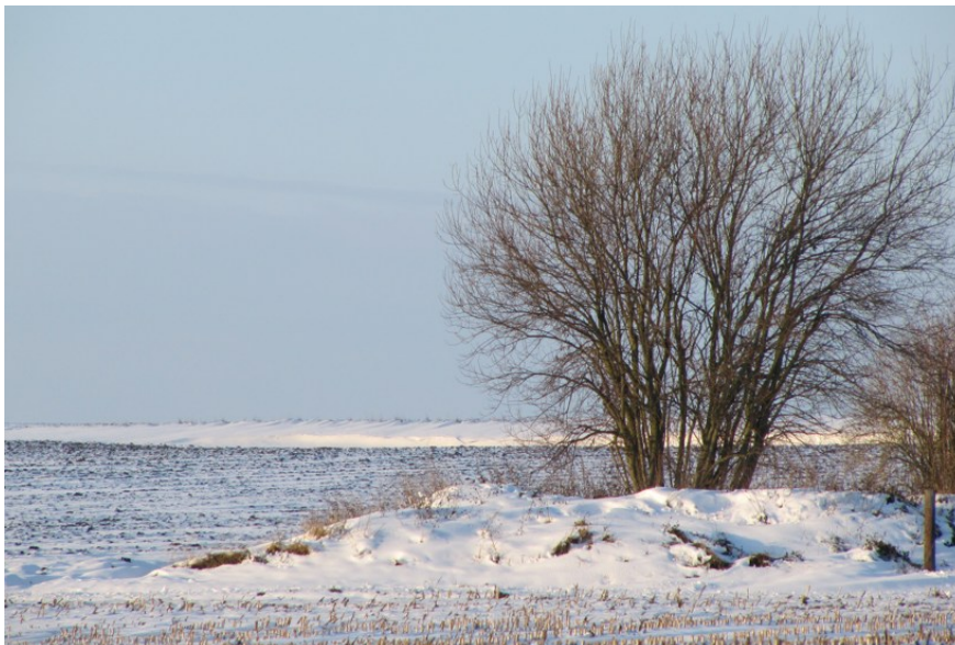
Vue de la « frête gringole » à partir de la route de Wavrechain. Décembre 2010